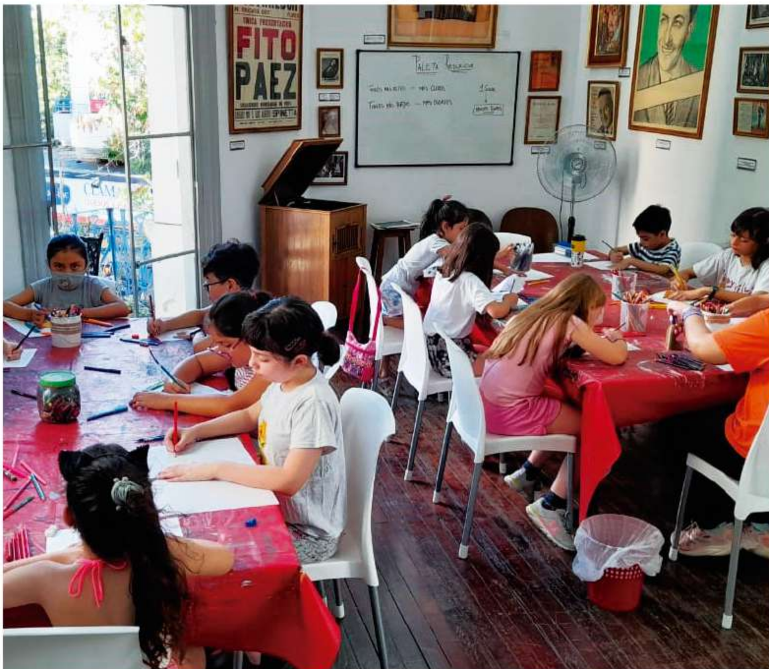
Vacaciones de Verano a pleno en el Museo Barrio de Flores. Las inscripciones para enero ya están abiertas.

Por sexta temporada consecutiva, el Museo Barrio de Flores ofrece para los chicos, entre 6 a 12 años, diez talleres educativos culturales para disfrutar de estas vacaciones de verano en el barrio. Las inscripciones ya están abiertas. (Más info en página 5).